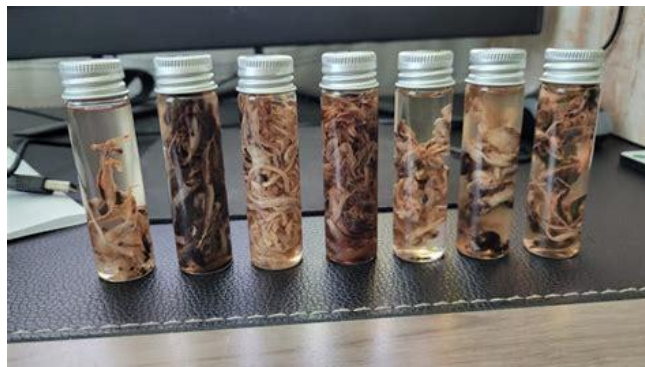
Caillots sanguins jamais vus auparavant

Nous voyons partout sur internet des vidéos d'enfants qui tombent dans la cour d'école ou des sportifs dans les stades, après une crise cardiaque. (3)